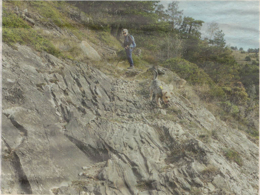
Détail du sentier facile au dessus d'Erschmatt.